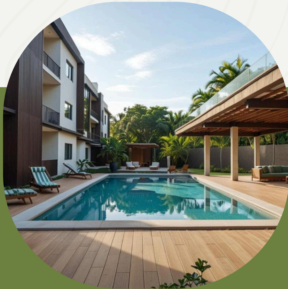
PISCINA ÁREA SOCIAL